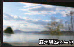
露天風呂(イメージ)

■旅行企画・実施/JTB中国四国 ■イベント企画/ベッキオバンビーノスペシャルステージ@しまのわチーム